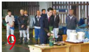
9 28.1.5 小浜中央青果初市