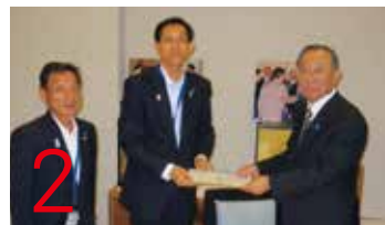
2 27.8.6 原子力発電所準立地協議会要望