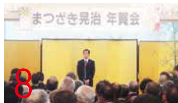
8 28.1.2 年賀会