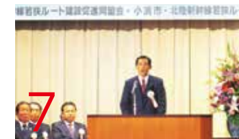
7 27.12.13 北陸新幹線若狭ルート建設促進総決起大会