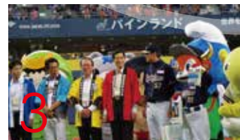
3 27.9.26 嶺南PRイベント (京セラドーム)