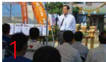
1 27.8.4 箸まつり開会式