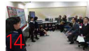
14 28.2.14 ふるさと小浜 MIRA I 事業