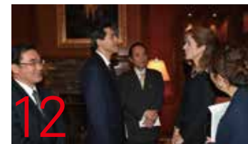
12 28.1.26 アメリカ大使館 ハナミズキレセプション