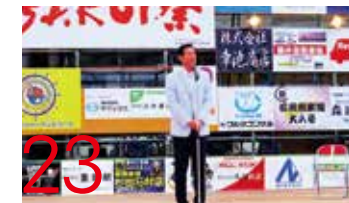
23 28.9.11 御食国若狭おばま YOSAKOI祭2016